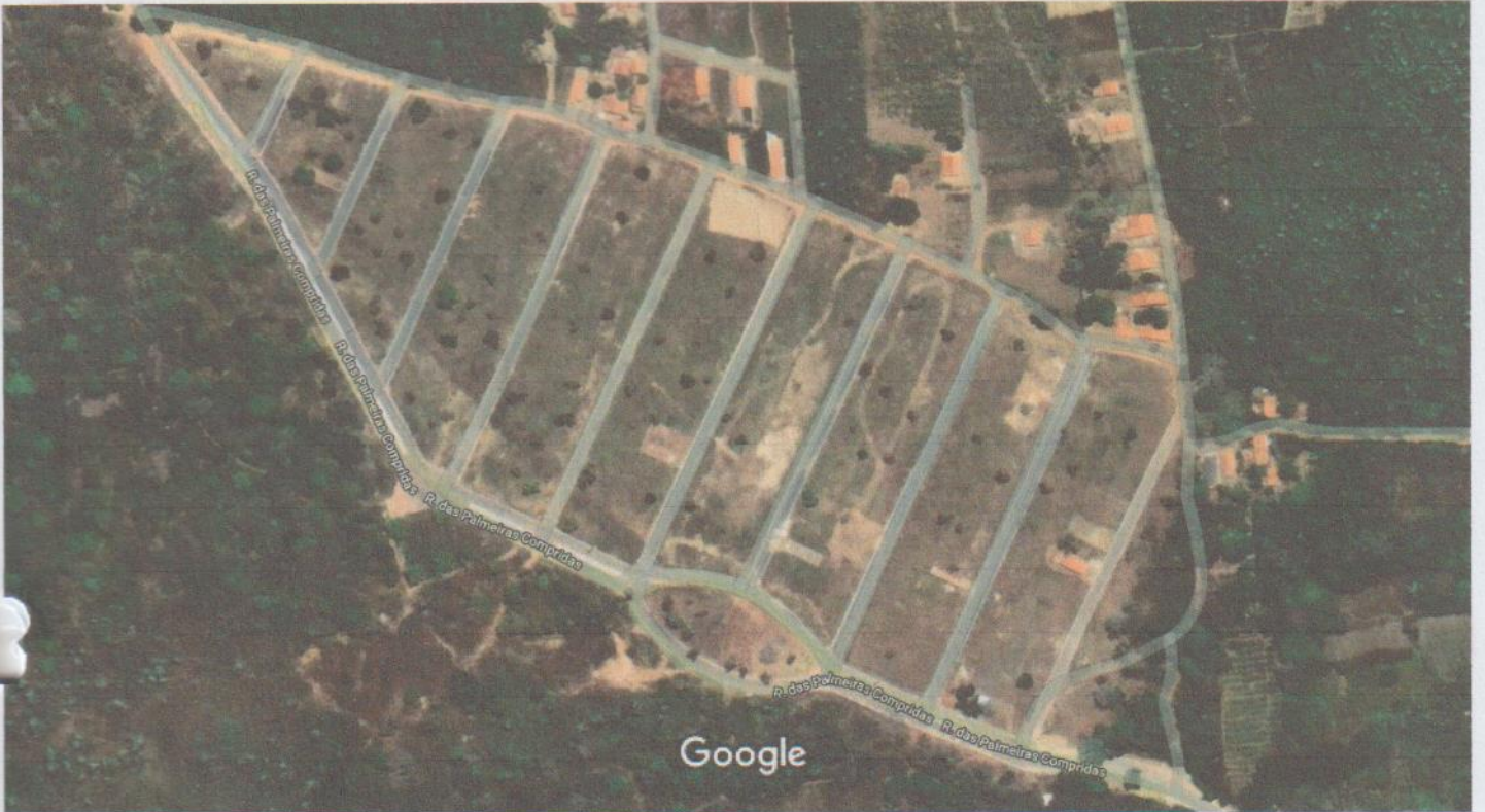
Imagens ©2023 CNES / Airbus, Maxar Technologies, Dados do mapa ©2023 50 m

... para a realização de obras de infraestrutura, bem como para a construção de edifícios e outros empreendimentos imobiliários. O presente projeto de lei visa a regulamentar a utilização das áreas destinadas a essas atividades, bem como estabelecer as condições para a outorga de direitos de uso e ocupação do solo.