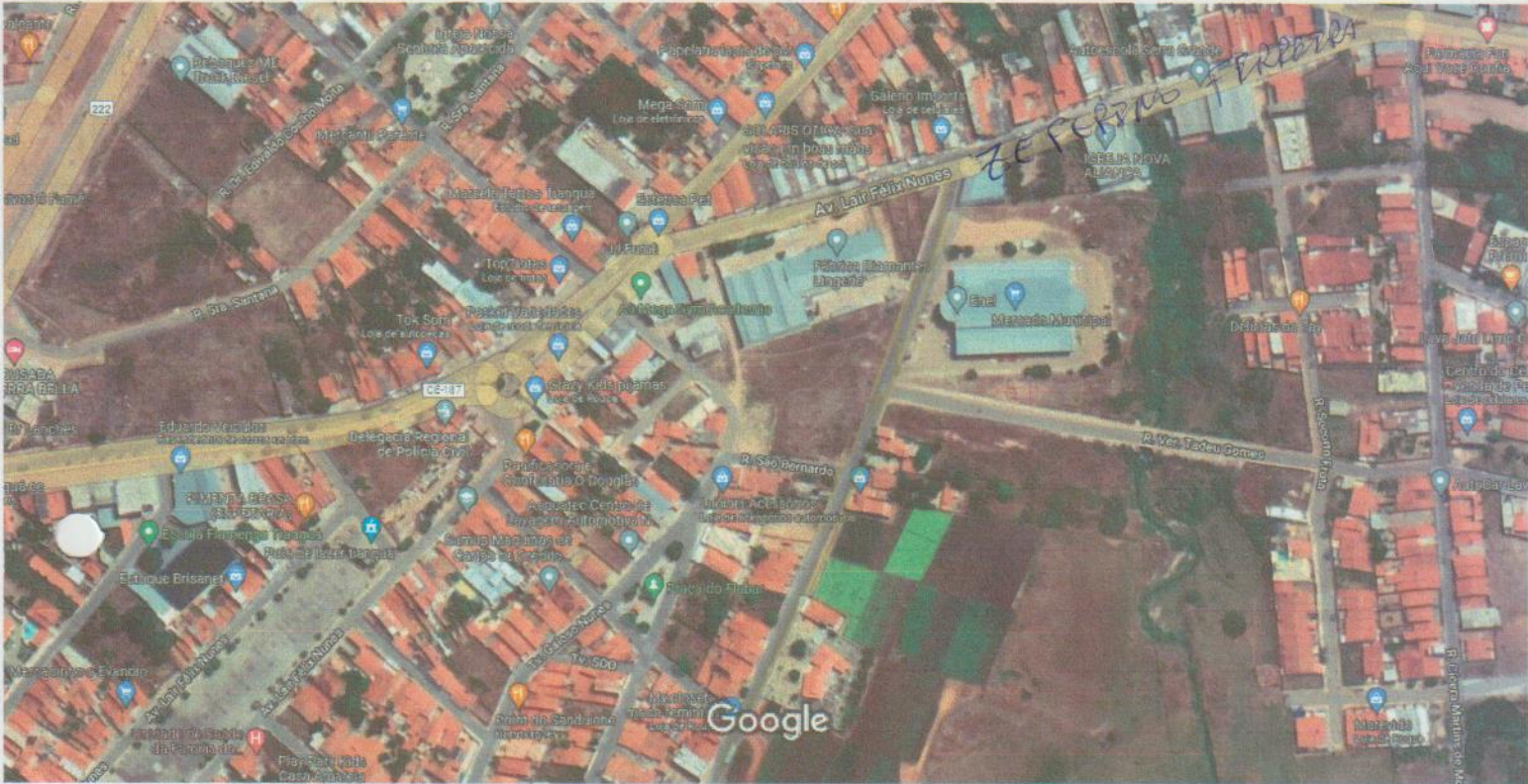
Imagens ©2022 CNES / Airbus, Maxar Technologies, Dados do mapa ©2022 50 m