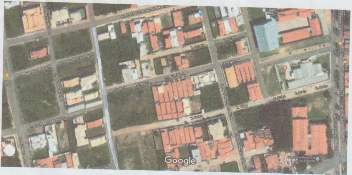
Imagens ©2021 CNES / Airbus,Maxar Technologies,Dados do mapa ©2021 20 m