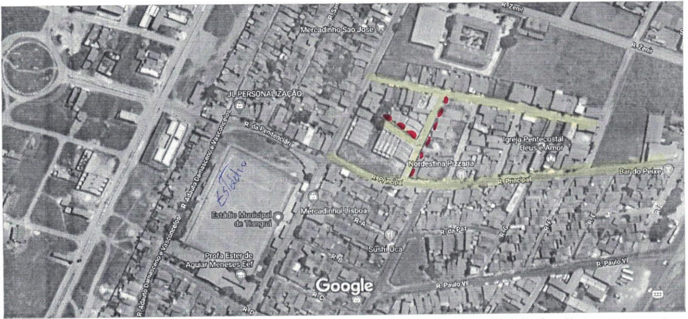
Imagens ©2018 CNES / Airbus, DigitalGlobe, Dados do mapa ©2018 Google 50 m