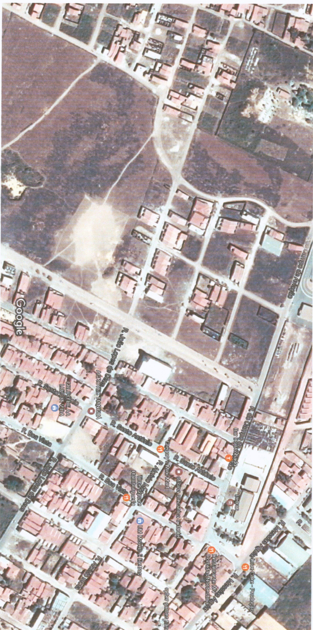
Imagens ©2017 CNES / Airbus.Dados do mapa ©2017 Google 50 m