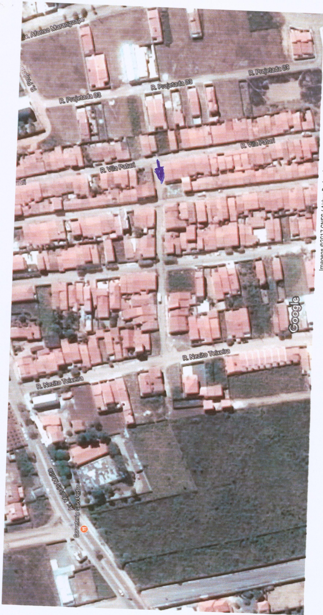
Imagens ©2017 CNES / Airbus,Dados do mapa ©2017 Google Brasil 20 m