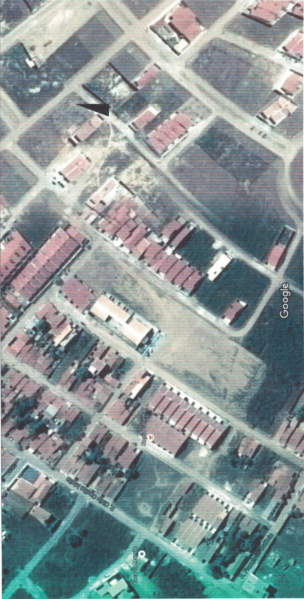
Imagens ©2016 CNES / Astrium,Dados do mapa ©2016 Google 20 m