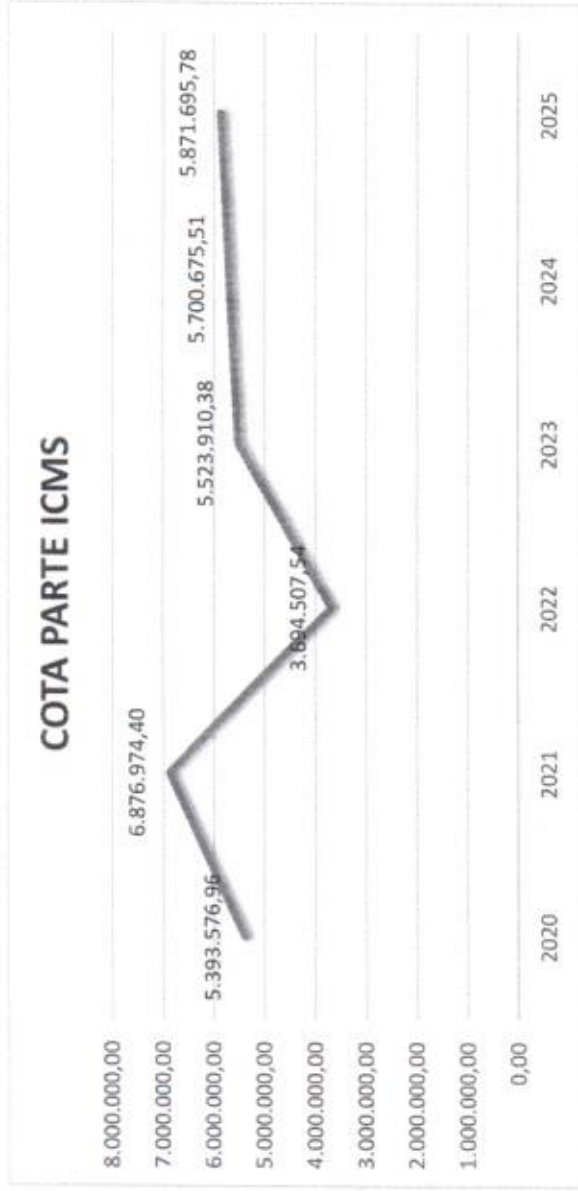
Gráfico 2 – Evolução das Transferências da Cota-Parte ICMS – 2020 a 2025

Os exercícios de 2020 a 2025 são valores previstos. Valores deduzidos do Fundeb.