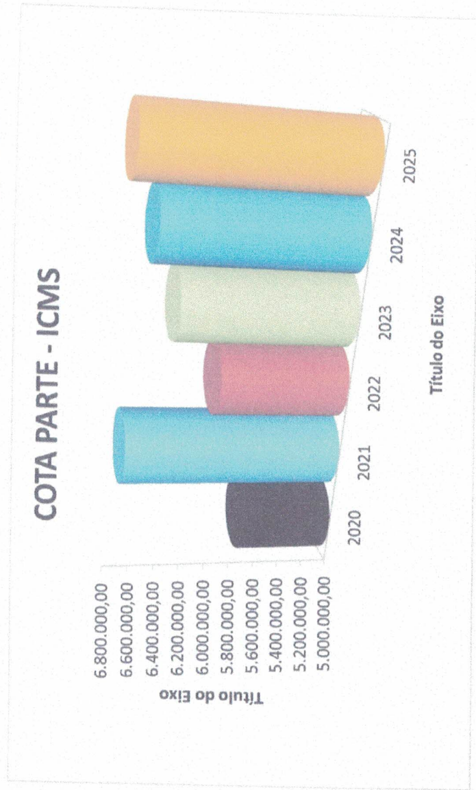
Gráfico 2 – Evolução das Transferências da Cota-Parte ICMS – 2020 a 2025

Os exercícios de 2022 a 2025 são valores previstos. Valores deduzidos do Fundeb.