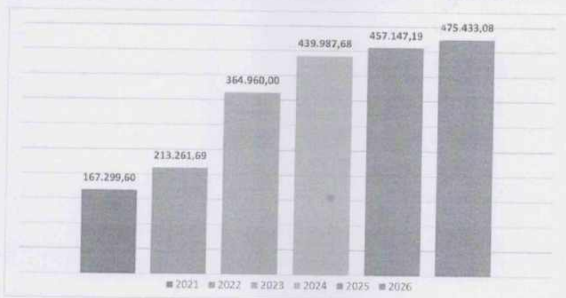
GRÁFICO 3 - EVOLUÇÃO DAS TRANSFERÊNCIAS DA COTA-PARTE IPVA – 2021 A 2026

FONTE 3 - SECRETARIA DE FINANÇAS. OS EXERCÍCIOS DE 2023 A 2026 SÃO VALORES PREVISTOS. VALORES DEDUZIDOS DO FUNDEB.